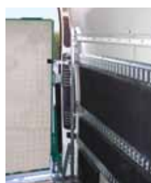
RAMPA CU SUPORT LATERAL ȘI CU BUTUC DUBLU