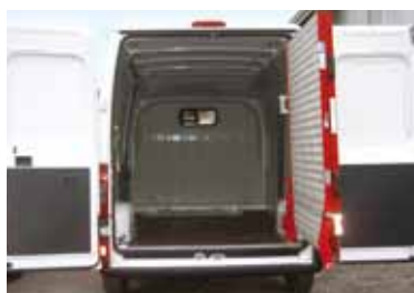
RAMPA CU PIVOT DREAPTA