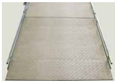
RAMPA CU MARGINILE LATERALE PLIABILE