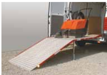
RAMPA CU PICIOR SPECIAL