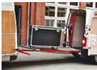
RAMPA FĂRĂ PICIOR CU DOUĂ PARȚI MOBILE